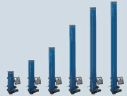
Lieferbare Anwendungsbereiche: 567mm / 872mm / 1278mm / 1786mm / 2296mm

Das ergonomische Design sowie die neusten Technologien bieten Ihnen einen bisher unerreichten Bedienkomfort. Funktionen die normalerweise als kompliziert eingestuft werden wie z. B. 2D-Messungen, Programmieren von Messfolgen, statistische Auswertungen werden mit dem industriellen und strapazierfähigen Taktildschirm zum Kinderspiel.